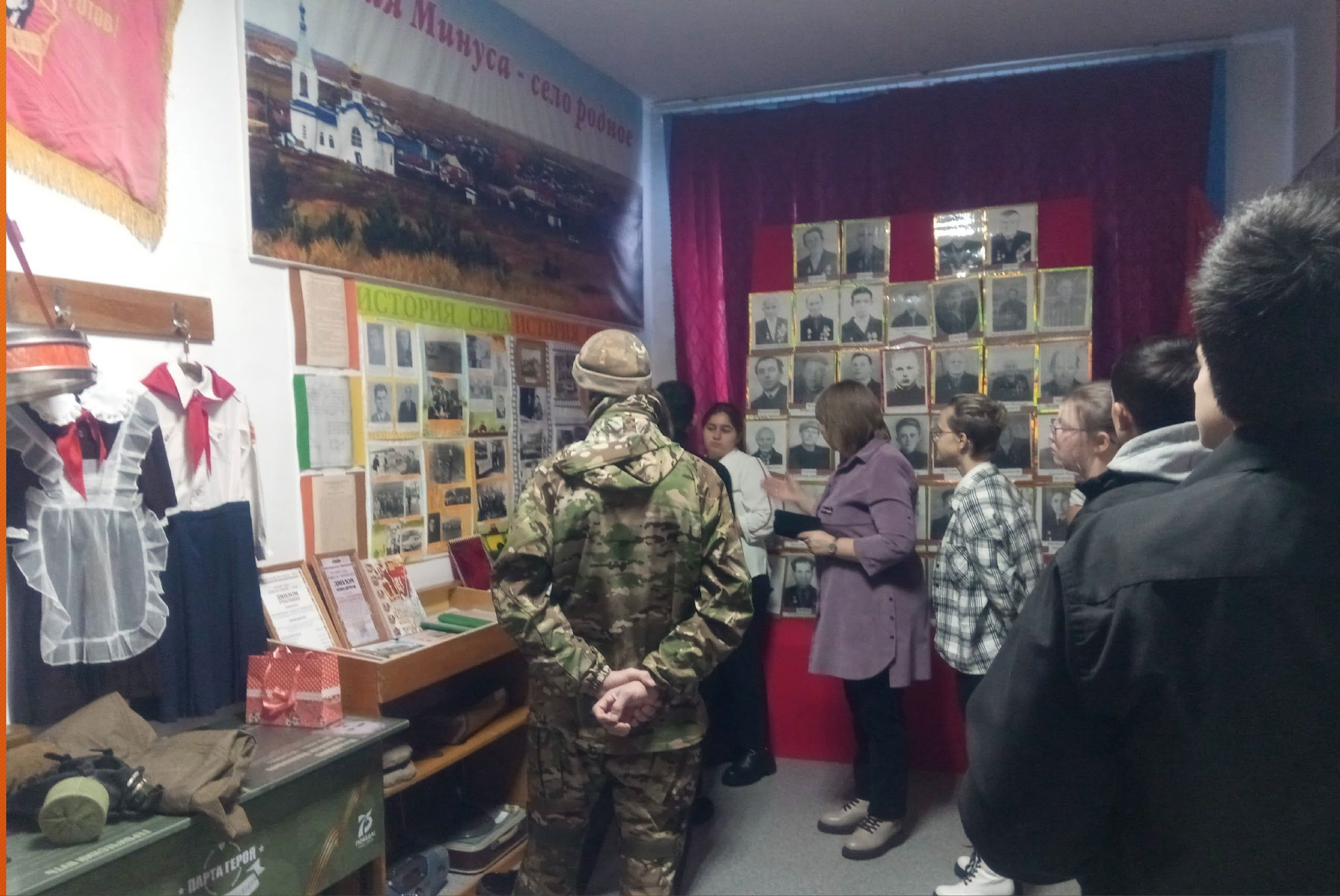
В школьном историко-краеведческом музее «Истоки»